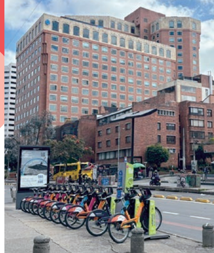
鮮やかでカラフルなシェアサイクル

稲毛区には、長年この街を支えてきた皆さまの豊かな経験と知恵があります。例えば、街の花壇をデザインしたり、美しさを保つメンテナンスに関わったり。自分たちの手が加わった街には、自然と愛着が湧くものです。「私たちの幕張」と胸を張れる仕組みを作ります。