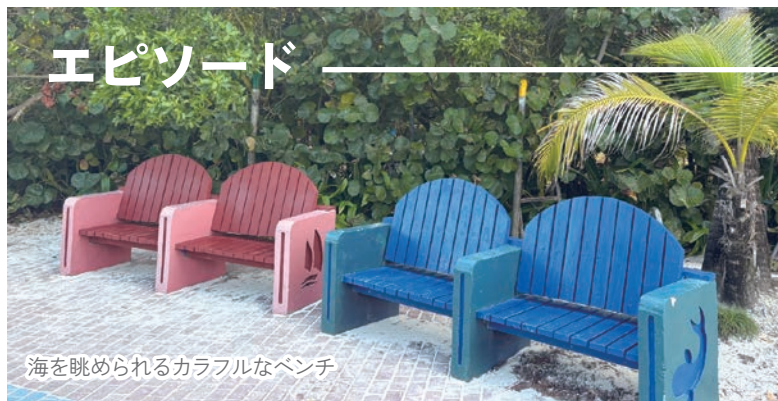
海を眺められるカラフルなベンチ

大きな障壁となっている「交通の便」改善に対して、バスロータリー拡張を始め、提言して参ります！