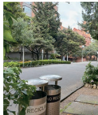
街並みに溶け込む緑とスタイリッシュなデザインのゴミ箱